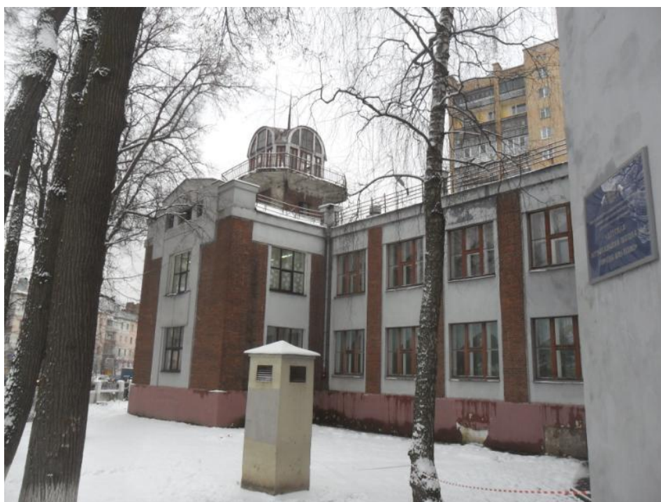
«Левое крыло» «школы-птицы» со стороны пр. Ленина