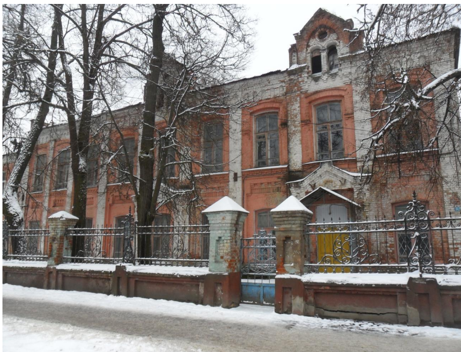
Детский приют. Главный фасад и ограда