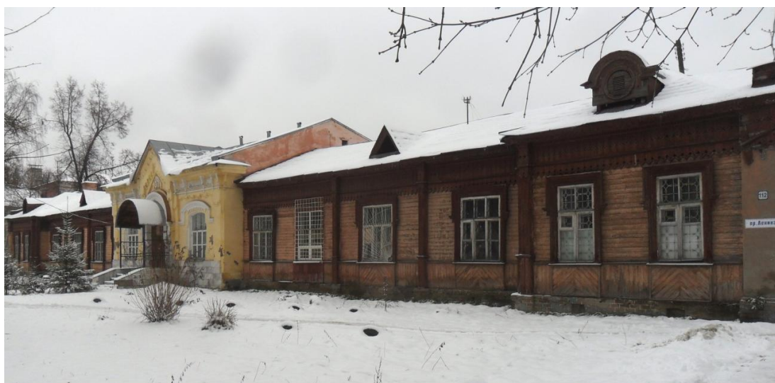
Инфекционный корпус. Главный фасад.