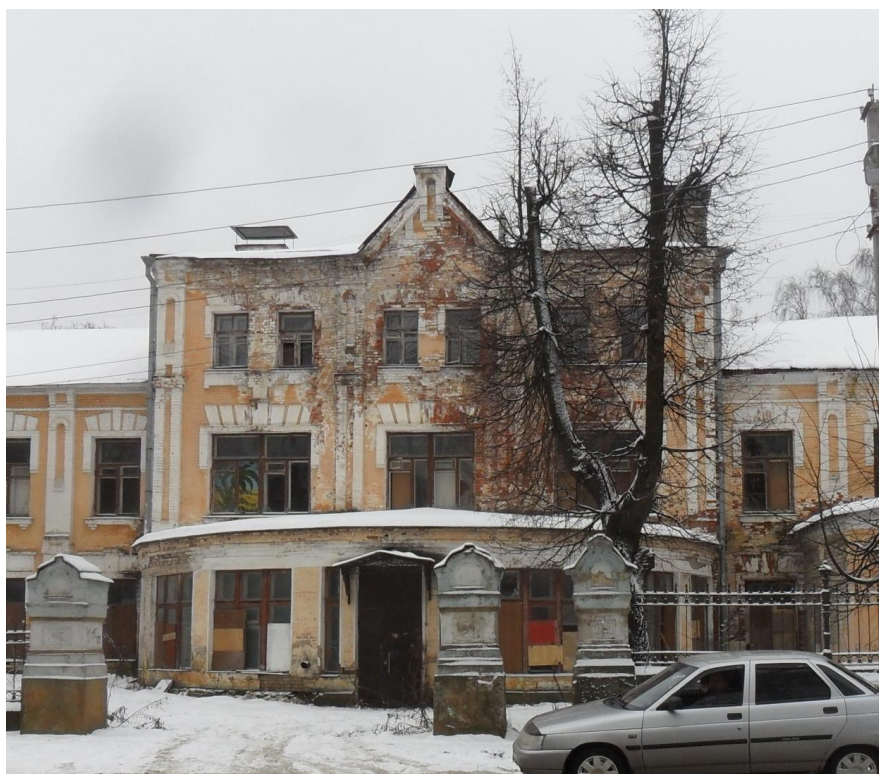
Хирургический корпус. Главный фасад. Центральная часть

«Комплекс больницы для мастеровых и рабочих», 1860-е-1910-е гг., расположенный по адресу Ивановская область, г.о. Иваново, пр. Ленина, 112, 112 (Литер А-А5); ул. Ермака, 3.