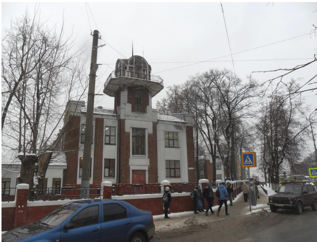
Астрономическая башня на «левом крыле» «школы-птицы» со стороны пр. Ленина