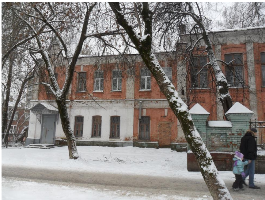
Блок бывшей богадельни. Главный фасад