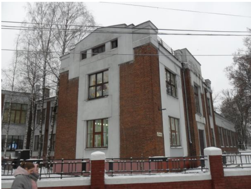
«Правое крыло» «школы-птицы» со стороны пр. Ленина

«Школа им. X-летия Октября», 1927-1928 гг., расположенная по адресу: г.о. Иваново, пр. Ленина, 53.