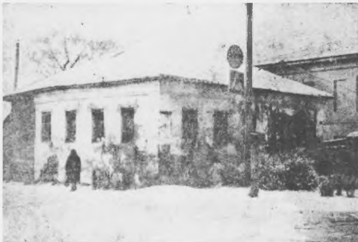
Фото 1970-х гг.

Пустырь на месте дома. Фото Сураевой Ю.А. 17.11.2016 .