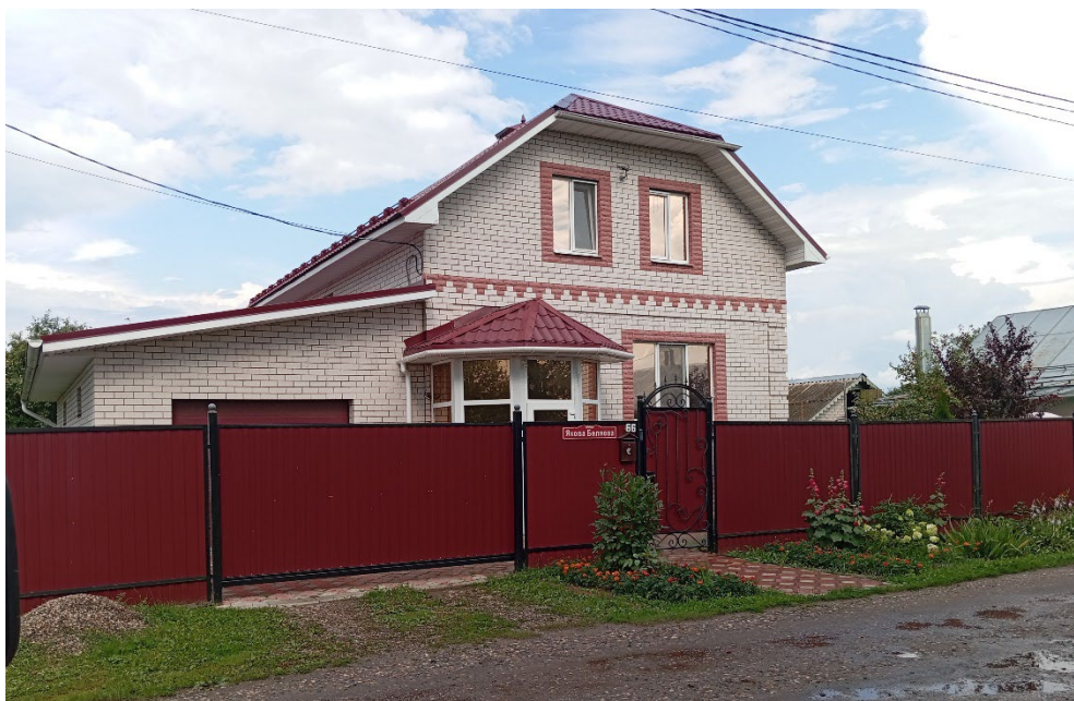
Фото 1. Общий вид объекта в 2025 г.

Натурные обследования объекта культурного наследия «Дом, в котором с 1932 по 1938 гг. жил Герой Советского Союза Я.Д. Беляев», расположенного по адресу: Ивановская обл., г. Кинешма, Якова Беляева ул., 66, показали, что он находится по красной линии улицы Беляева в ряду застройки. Ныне это двухэтажный коттедж из силикатного кирпича с включениями красного кирпича, возведенный в 2000-е гг.