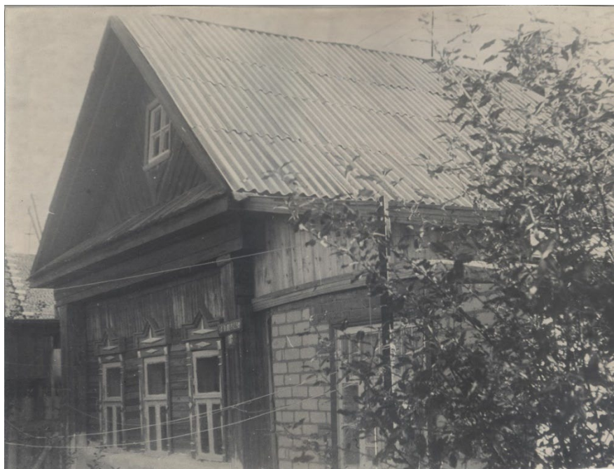
Рис. 2. Фото объекта в 1973 г. из архива Комитета Ивановской области по государственной охране объектов культурного наследия