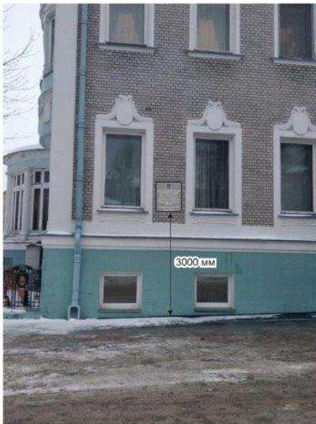
Схема установки информационной надписи на объект культурного наследия и цветная фотофиксация объекта культурного наследия с указанием места предполагаемого размещения информационной надписи.

Проект информационных надписей и обозначений, устанавливаемых на объекте культурного наследия федерального значения «Дом , в котором в 1918 г. находился губсоднархоз, председателем которого был Батурина Павел Степанович» 1909-1911 гг. Расположенном по адресу: Ивановская область, г. Иваново, ул. Батурина, д.5