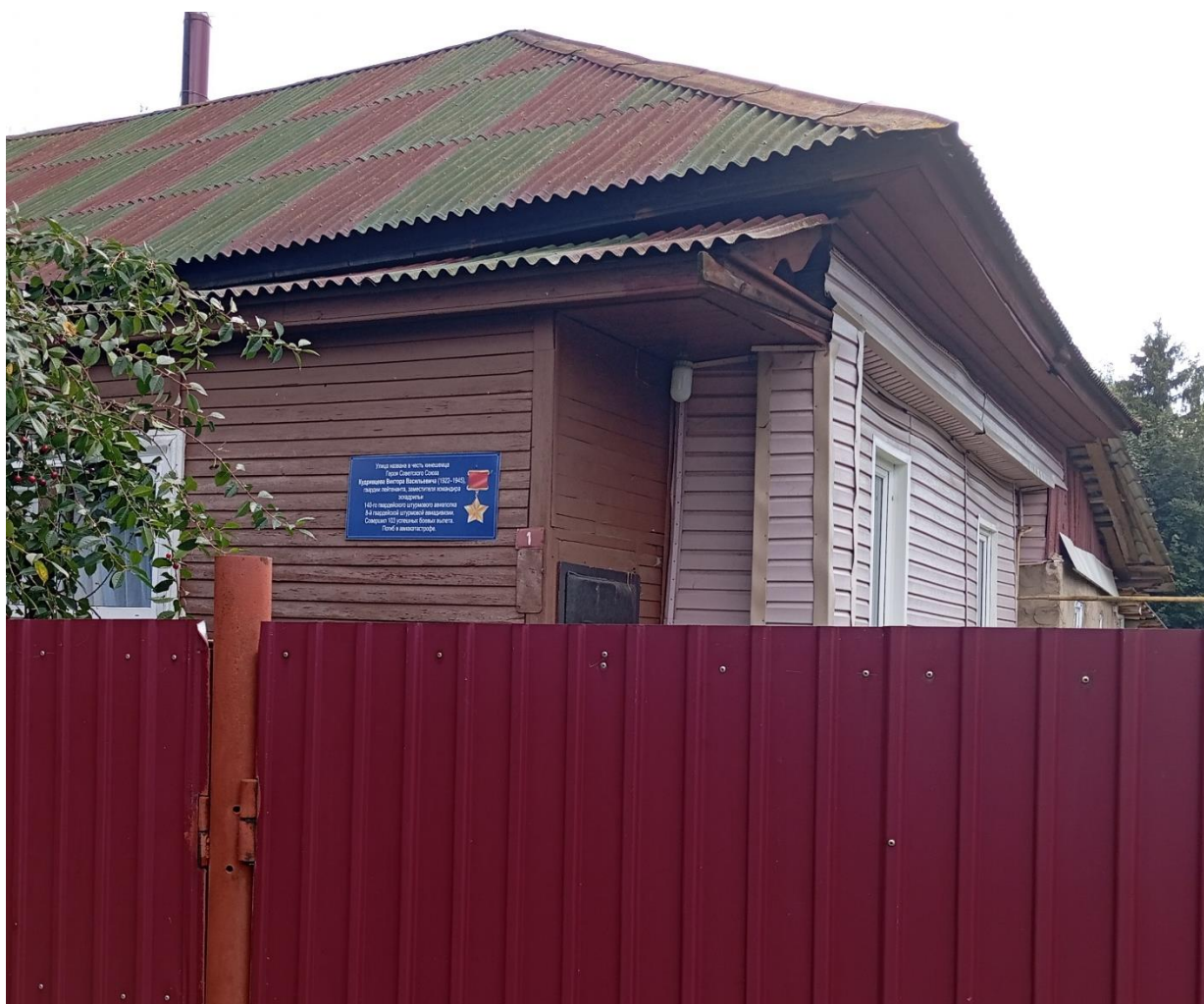
Фото 4. Информационная табличка на доме № 1.