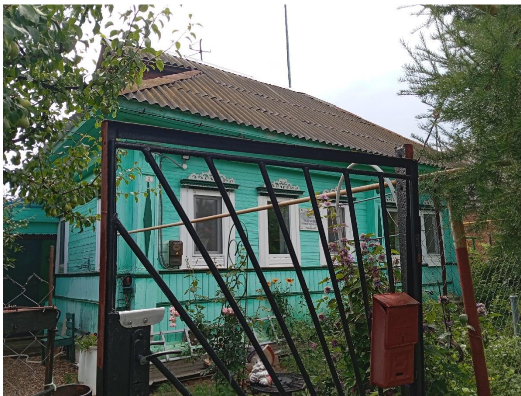
Фото 1. Общий вид объекта в 2025 г.

Натурные обследования объекта культурного наследия «Дом, в котором родился и жил с 1922 по 1941 гг. Герой Советского Союза В.В. Кудрявцев», расположенного по адресу: Ивановская обл., г. Кинешма, Виктора Кудрявцева ул., 3, показали, что он находится по красной линии улицы Виктора Кудрявцева в ряду застройки. Это одноэтажный деревянный дом в 5 окон по фасаду, сгруппированных как 3+2 с деревянными лопатками на углах и между группами окон на главном фасаде. Крыша – вальмовая, крыта шифером. На главном фасаде установлена мемориальная доска. Дом построен в 1910 году.