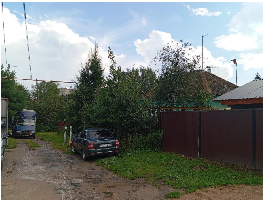
Фото 3. Общий вид улицы В.В. Кудрявцева.