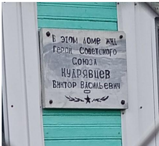
Фото 2. Мемориальная доска на доме.

Судя по архивным фото объём дома сохранился в первоначальном виде. Однако утрачены первоначальные наличники окон, исторические рамы заменены на новые пластиковые с полным изменением рисунка расстекловки, кровля с металлической заменена на шиферную.