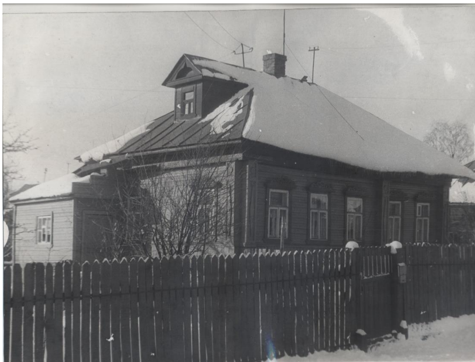
Рис. 2. Фото объекта в 1973 г.

Судя по архивным фото объём дома сохранился в первоначальном виде. Однако утрачены первоначальные наличники окон, исторические рамы заменены на новые пластиковые с полным изменением рисунка расстекловки, кровля с металлической заменена на шиферную.