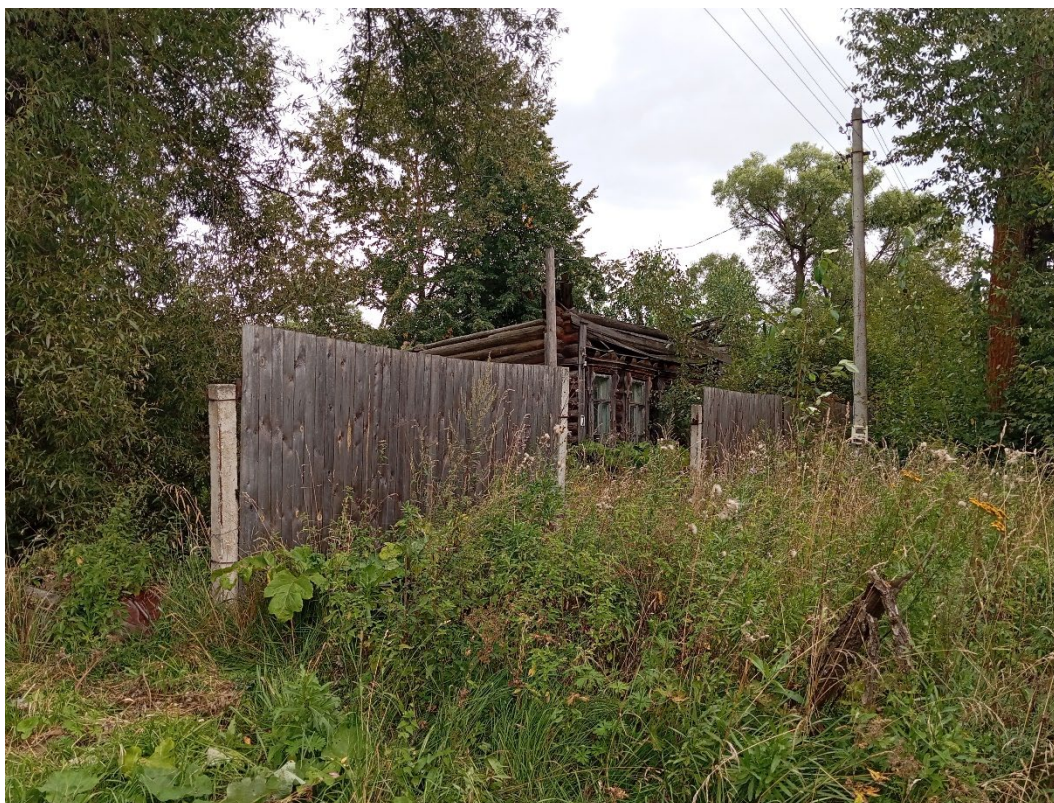
Фото 2. Вид на дом № 7