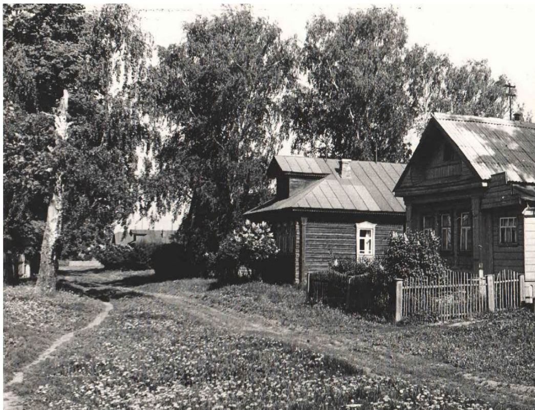
Рис. 2. Фото объекта в 1975 г.

Тем не менее, события в селе связаны не столько с домом организатора ячейки, сколько в единении жителей в борьбе за свои права и совместным трудом. Вместе с тем история села богата и на иные события.