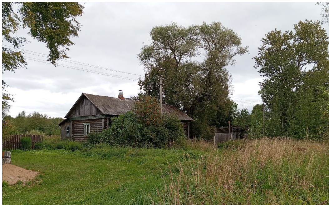
Фото 1. Общий вид на застройку села у дома № 7

Натурные обследования объекта культурного наследия выявили, что историческая улица села имеет традиционную застройку деревянными жилыми домами, весьма скромными по своему архитектурному решению.