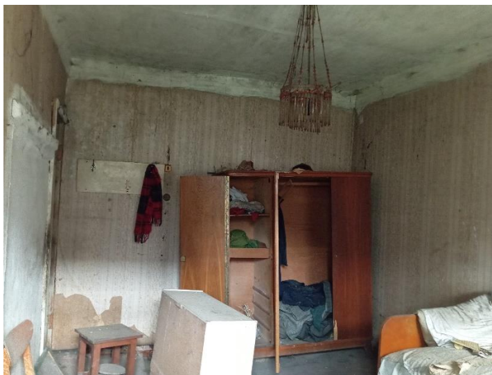
Фото 4, 5. Интерьеры здания

Таким образом, исторический дом, в котором родился и жил видный советский учёный А.И. Зимин, сохранился, но претерпел изменения своего внешнего исторического облика.