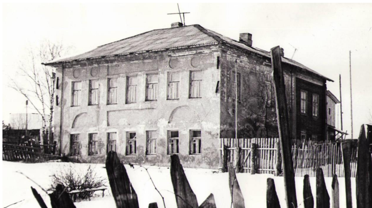
Рис. 2. Фото дома в 1982 г.

Декоративного решения интерьеров не существует, за исключением периметральных тяг на потолках.