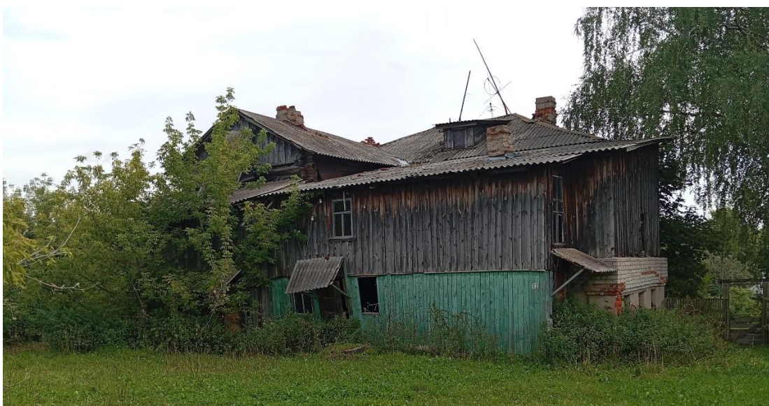
Фото 1. Вид объекта со стороны Совхозной пл.

Здание обращено к площади задним фасадом, решённым крайне утилитарно в виде деревянной пристройки к основному кирпичному объёму.