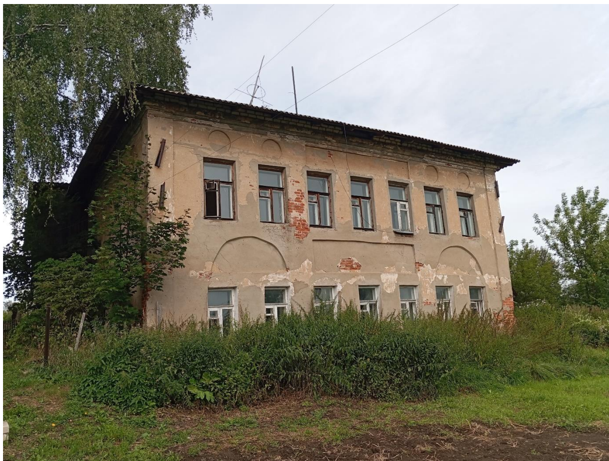
Фото 2. Вид главного фасада объекта с юга.

Декоративное решение имеется только на главном фасаде. На его углах – широкие плоские лопатки. Центр выделен широкой горизонтальной филёнкой над тремя средними окнами как над окнами первого, так и над окнами второго этажей. Над двумя боковыми окнами с каждой стороны от центральных трёх – единые неглубокие арочные филёнки, над боковыми окнами 2-го этажа – круглые филёнки. Венчает все кирпичные фасады многоступенчатый карниз.