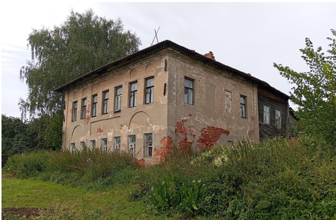
Фото 3. Вид главного фасада объекта с юга.