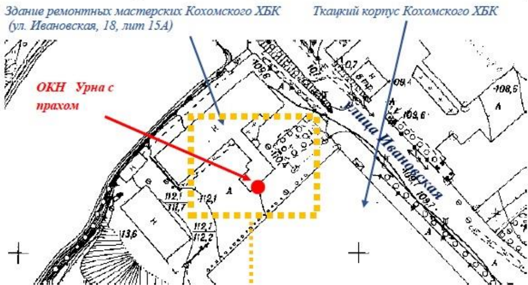
Схема границ (масштаб 1:500)