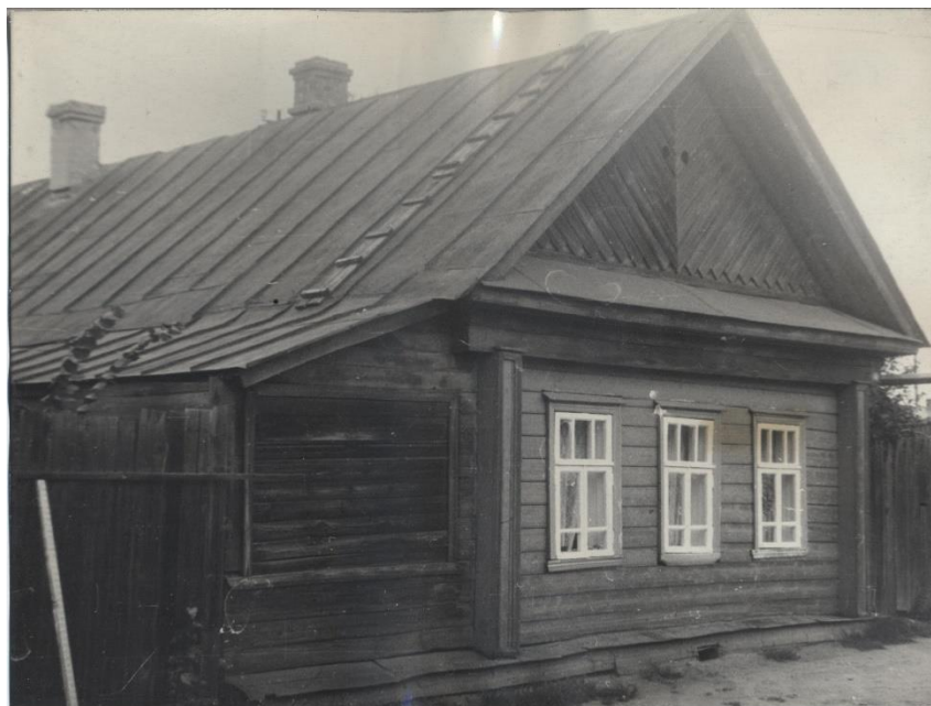
Рис. 2. Фото объекта в 1973 г.

Таким образом, исторический дом, в котором проживал Герой Советского Союза В.Д. Стрелков, не сохранился.