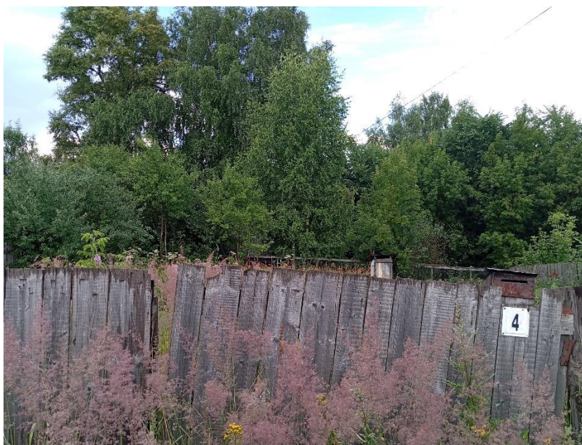
Фото 1. Общий вид объекта в 2025 г.

Натурные обследования объекта культурного наследия «Дом, в котором родился и с 1922 по 1940 гг. жил Герой Советского Союза В.Д. Стрелков», расположенного по адресу Ивановская обл., г. Кинешма, Пролетарский проезд, 4, показали, что земельный участок с таким адресом примыкает к красной линии улицы Пролетарского проезда и ряду застройки. Однако на данном земельном участке отсутствуют строения. Исторический дом снесён.