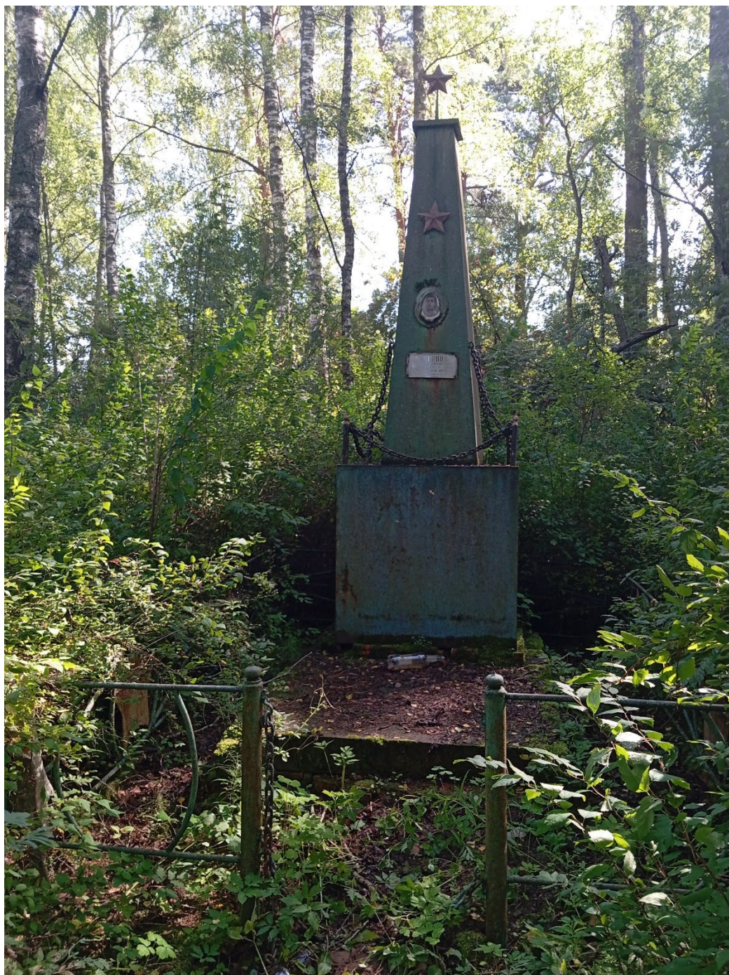
Фото 1. Общий вид объекта.

Данных о времени создания обелиска не имеется.