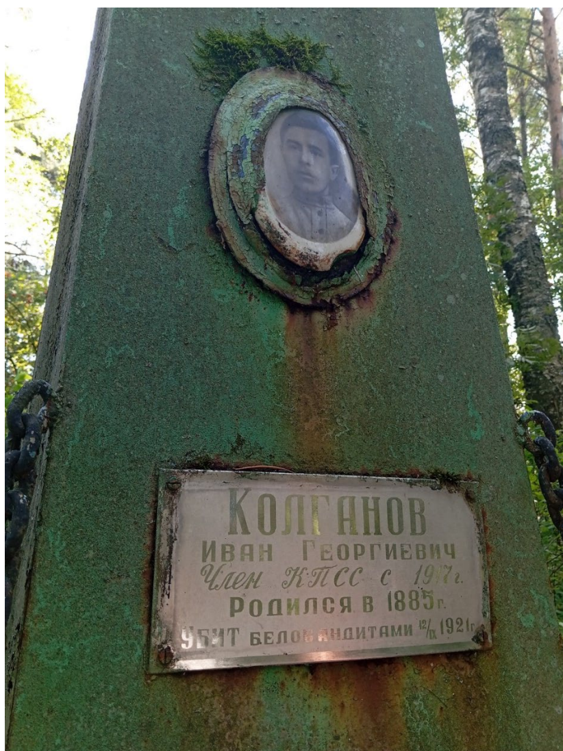
Фото 2. Фасадная плоскость обелиска.