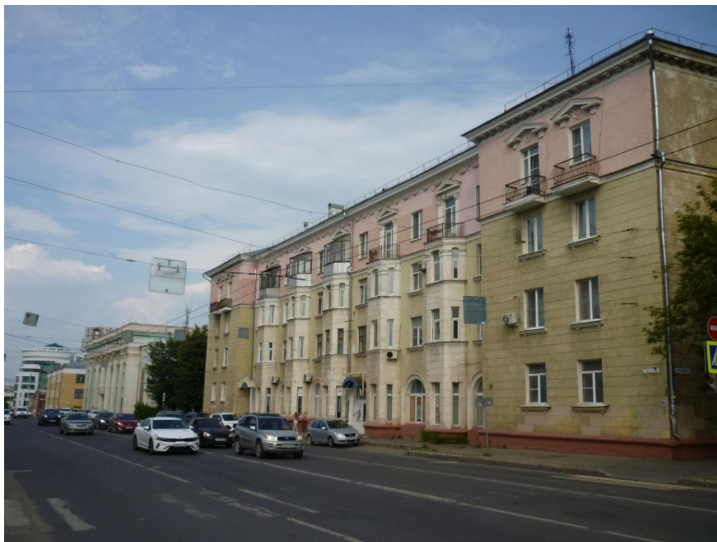
1. Общий вид достопримечательного места.

«ДК работников местной промышленности» (Ивановская область, г. Иваново, Почтовая ул., 3); «43 квартирный дом на Почтовой» (Ивановская область, г. Иваново, Почтовая ул., 5).