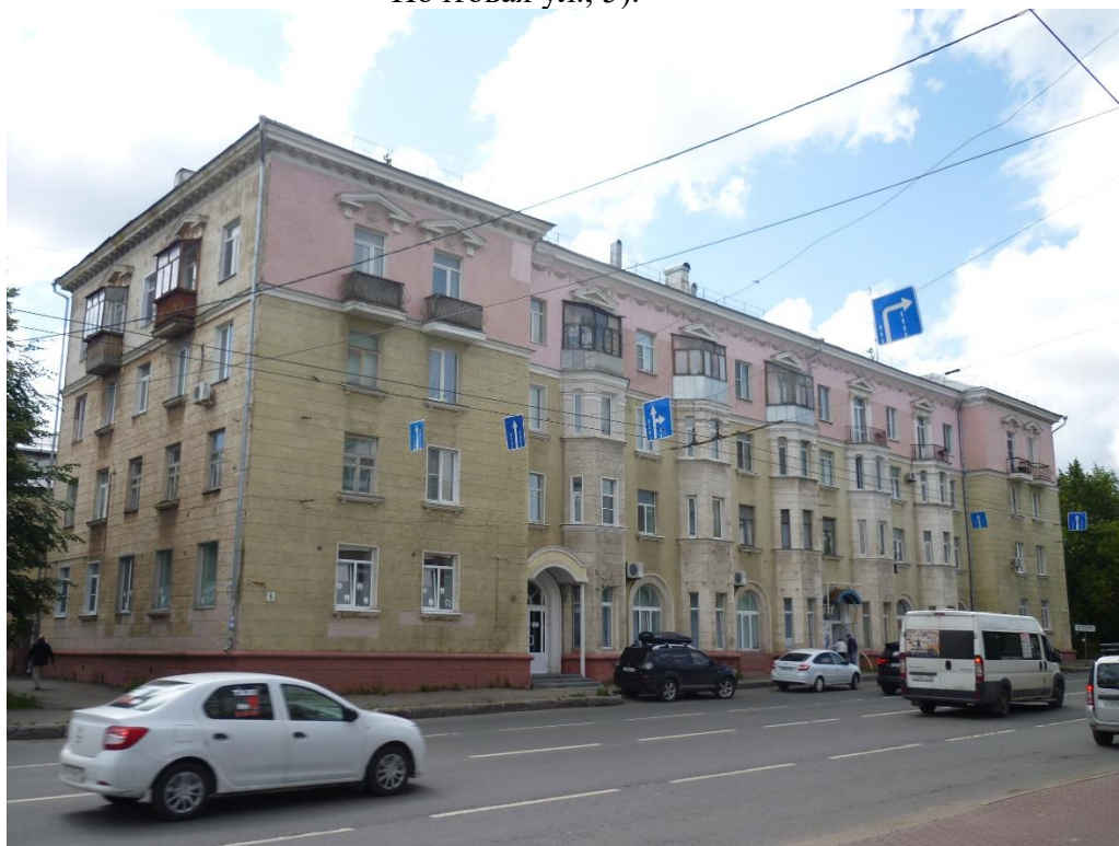
5. 43-квартирный дом завода автокранов.

«ДК работников местной промышленности» (Ивановская область, г. Иваново, Почтовая ул., 3); «43 квартирный дом на Почтовой» (Ивановская область, г. Иваново, Почтовая ул., 5).