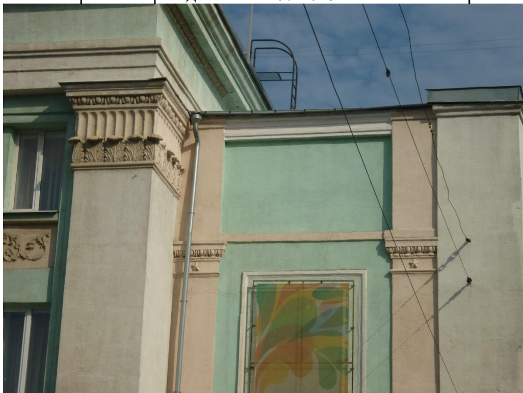
4. ДК работников местной промышленности (Почтовая ул., 3). Фрагмент фасада.