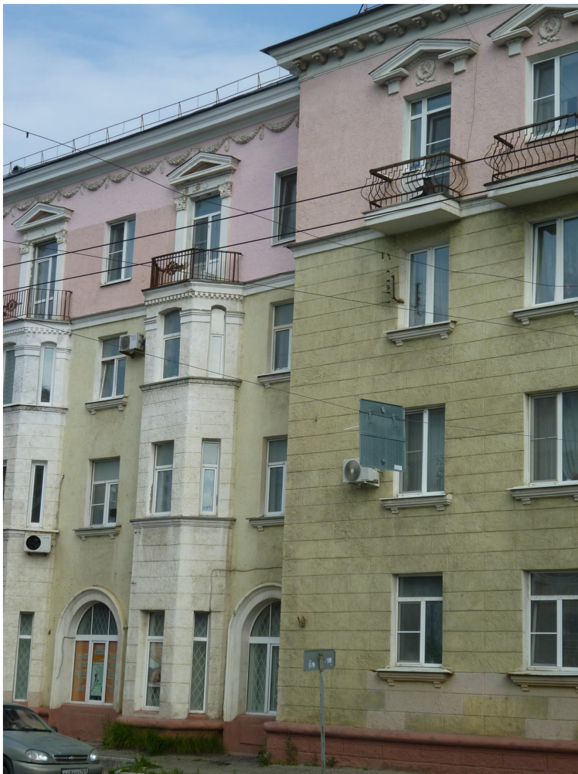
7. 43-квартирный дом завода автокранов. Фрагмент фасада.

«ДК работников местной промышленности» (Ивановская область, г. Иваново, Почтовая ул., 3); «43 квартирный дом на Почтовой» (Ивановская область, г. Иваново, Почтовая ул., 5).