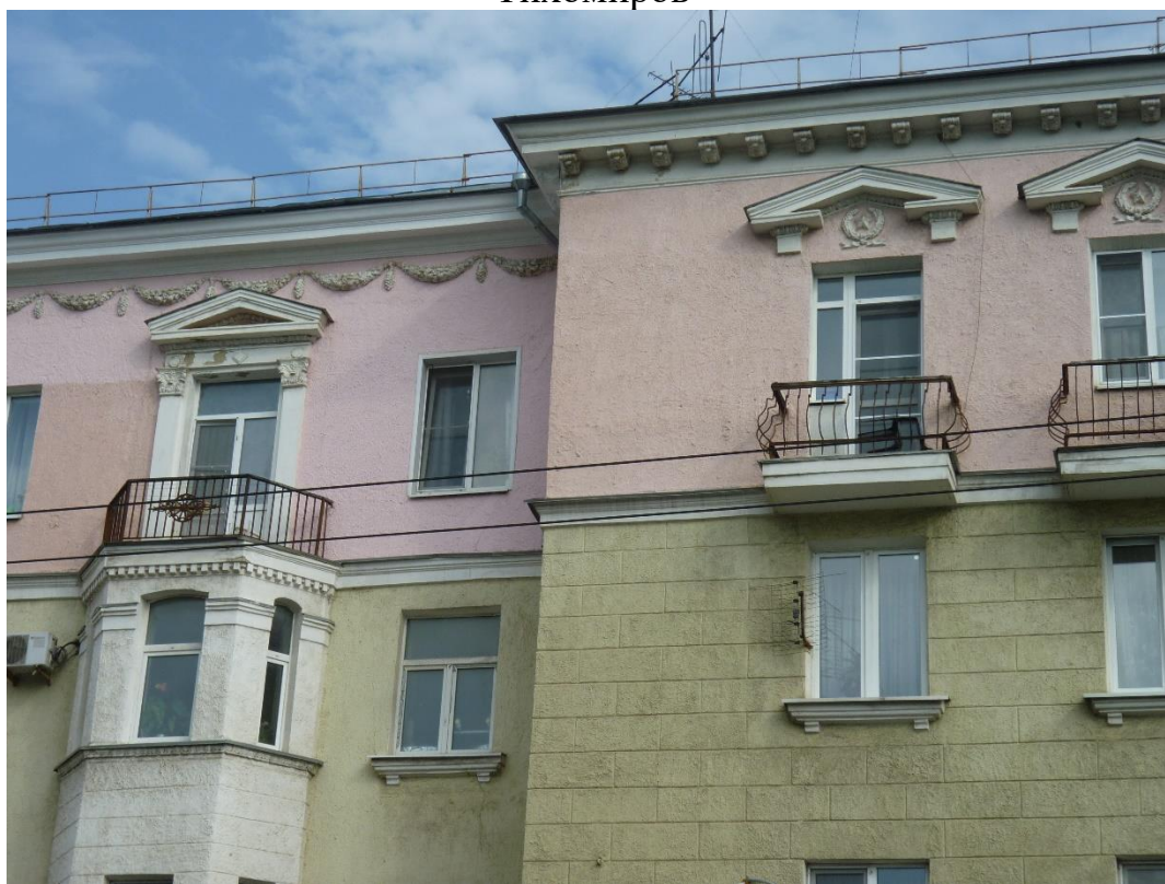
6. 43-квартирный дом завода автокранов. Фрагмент фасада.