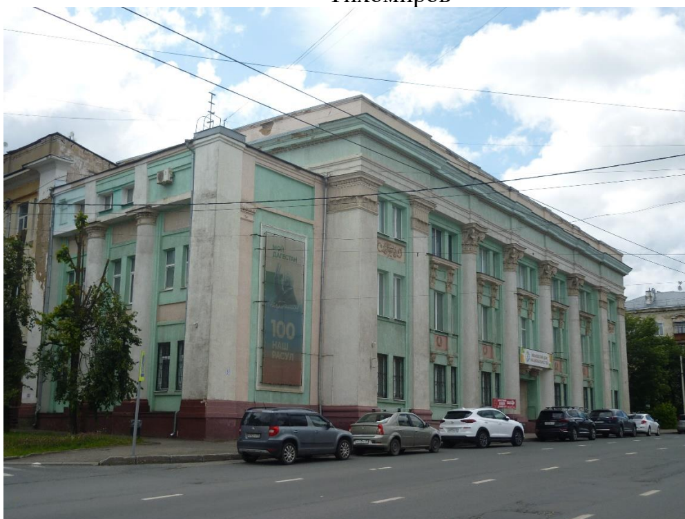
2. ДК работников местной промышленности (Почтовая ул., 3).