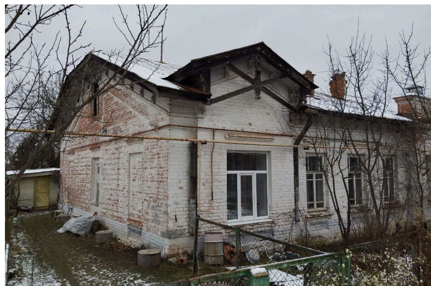
Фото 1, 2, 3. Общий вид дома