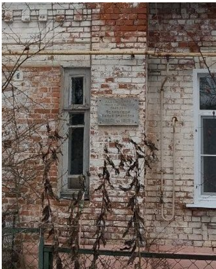
Фото 4. Мемориальная табличка на доме.

На доме имеется мемориальная табличка о том, что здесь проживала Челнокова Лидия Ивановна.