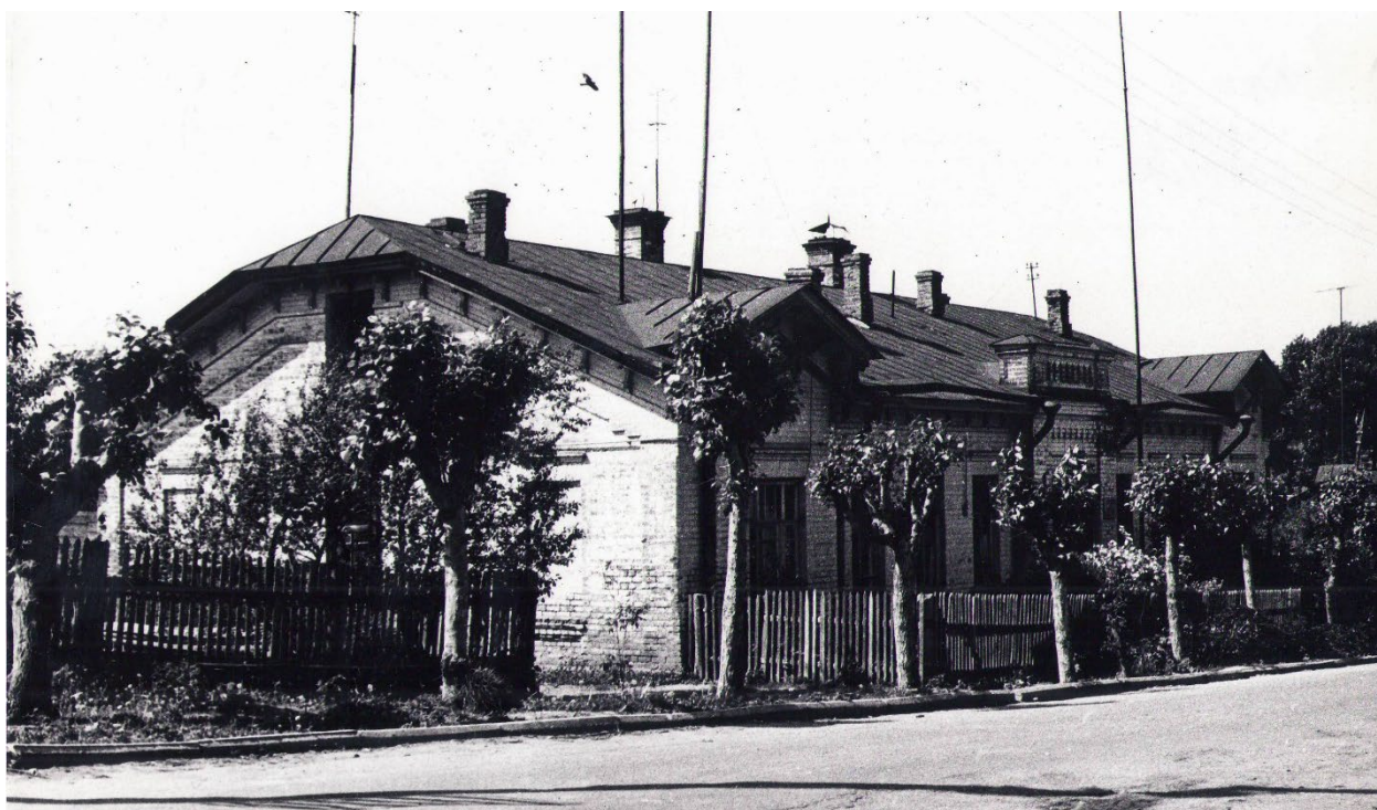
Рис. 2. Фото дома в 1975 г. из архива Комитета Ивановской области по государственной охране объектов культурного наследия.