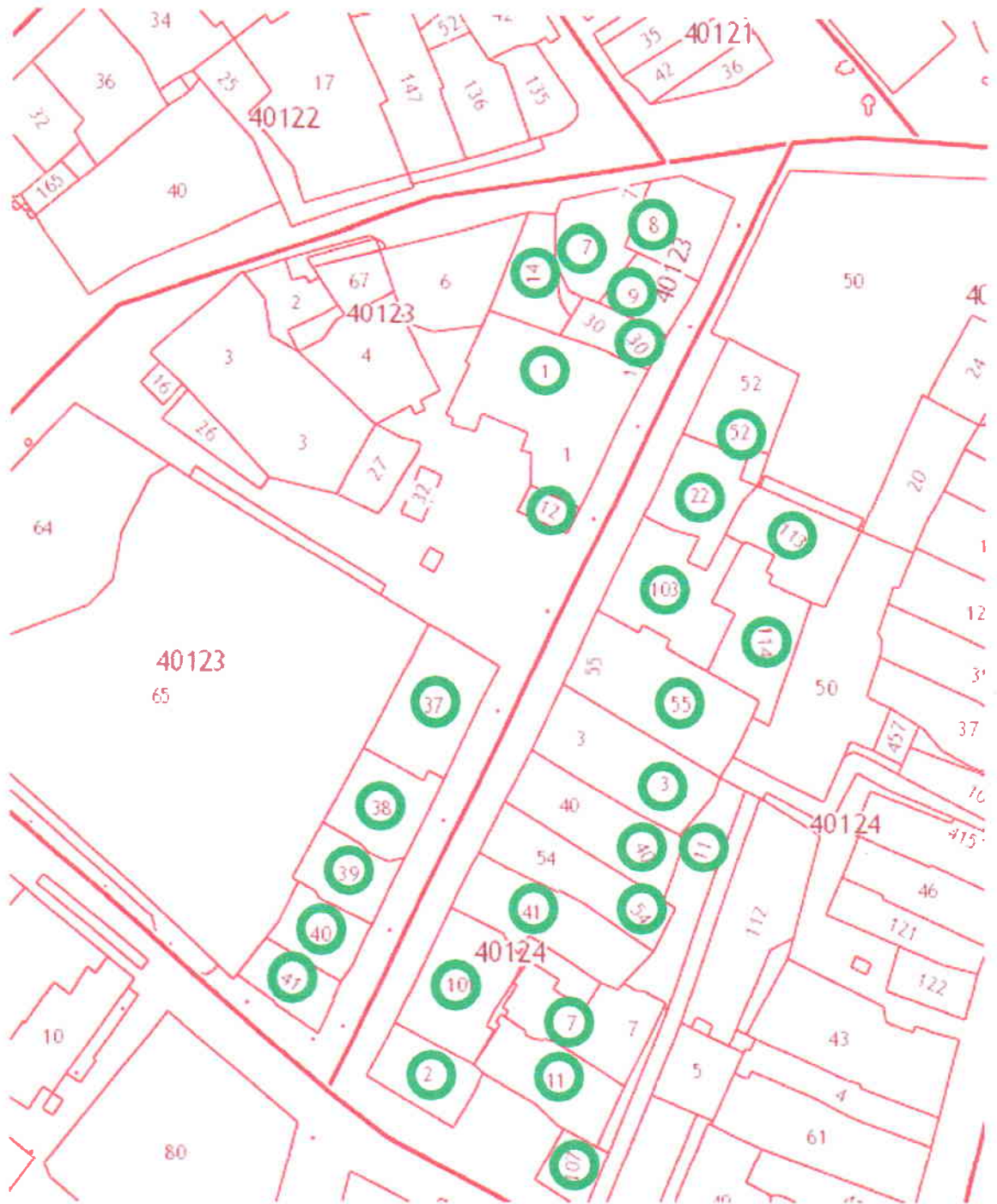
Рис.1. Публичная кадастровая карта места расположения территории объекта культурного наследия. Номера крупных земельных участков территории ОКН обведены зеленым.