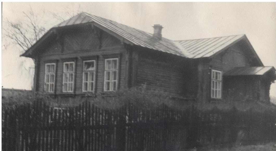
1. Фото 1974 г.

«Одно из зданий Воскресенской средней школы, в которой учился с 1916 по 1919 гг. Герой Советского Союза В.М. Горелов» (Ивановская обл., Лежневский район, с. Воскресенское).