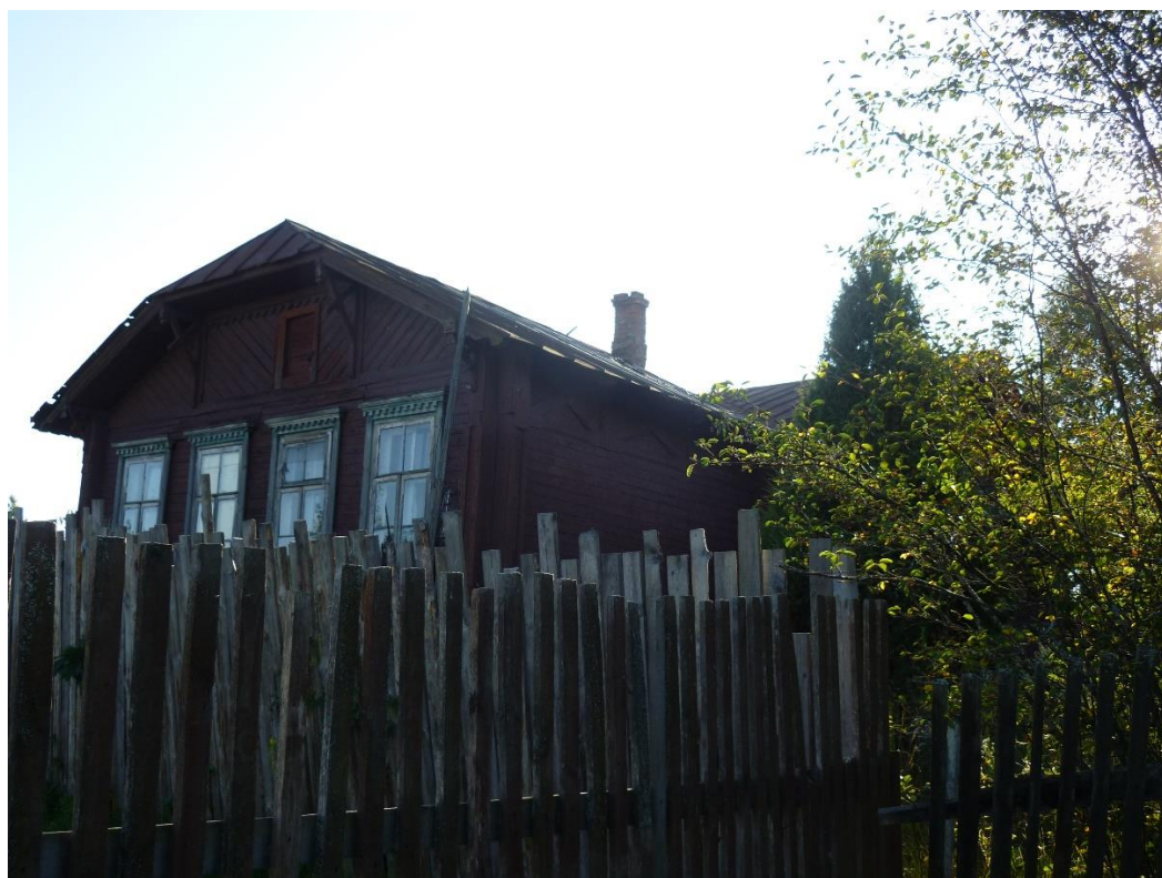
2. Вид со стороны главного фасада.