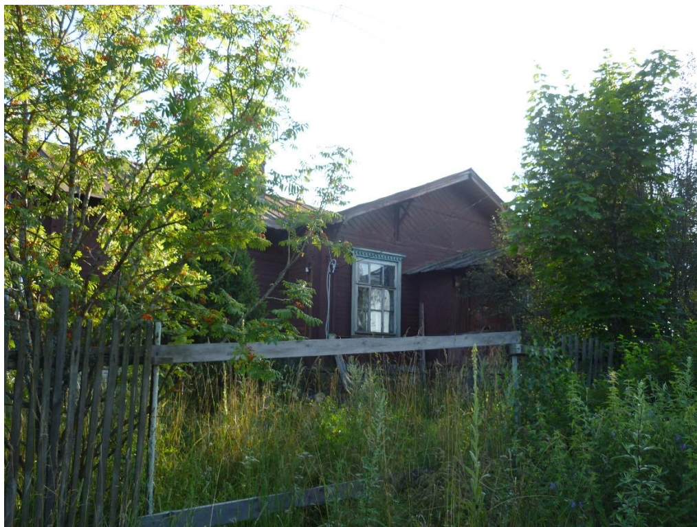
3. Вид со стороны бокового фасада.