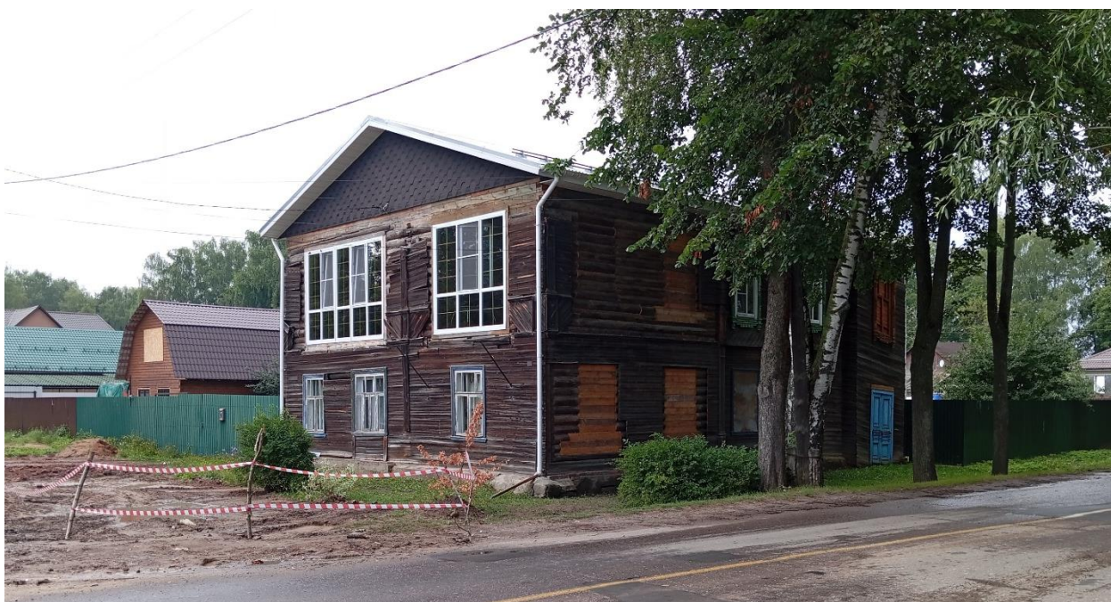
Фото 1. Общий вид дома № 6/16 в 2025 г.