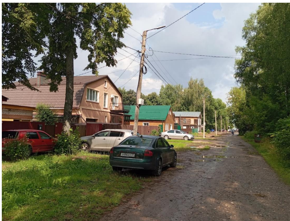
Фото 2. Общий вид улицы Чаева

В целом улица Чаева представляет собой рядовую улицу, застройка которой уже, к сожалению, не сохранила свой исторический облик и образ. В историческую застройку вторглись современные здания, а многие старые пре-терпели реконструкцию в утилитарном современном стиле с применением как современных строительных материалов, так и архитектурно-композиционных приёмов, не предусматривающих изящных декоративных элементов.