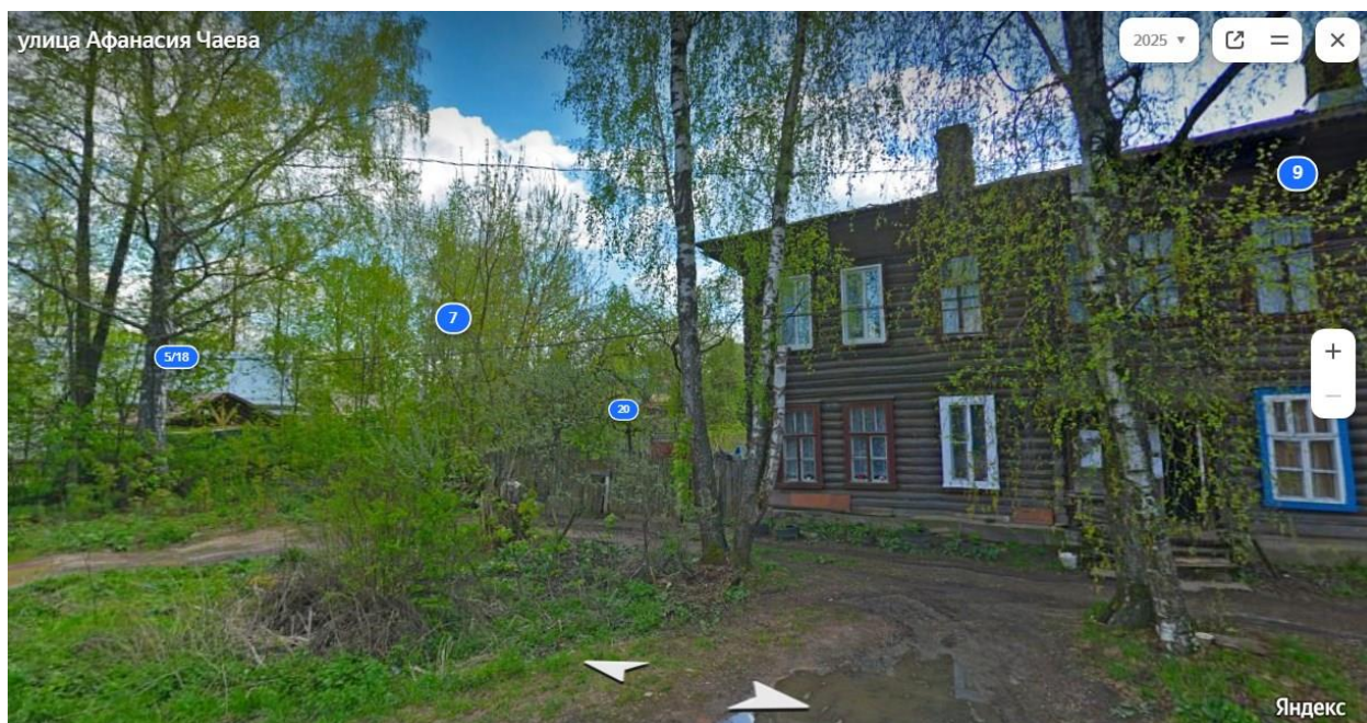
Рис. 5. Скриншот интернет ресурса Яндекс карта. Пустое место на месте снесенного дома обозначено синим кружком с цифрой 7. Справа от него – дом № 9.

В целом улица Чаева представляет собой рядовую улицу, застройка которой уже, к сожалению, не сохранила свой исторический облик и образ. В историческую застройку вторглись современные здания, а многие старые пре-терпели реконструкцию в утилитарном современном стиле с применением как современных строительных материалов, так и архитектурно-композиционных приёмов, не предусматривающих изящных декоративных элементов.