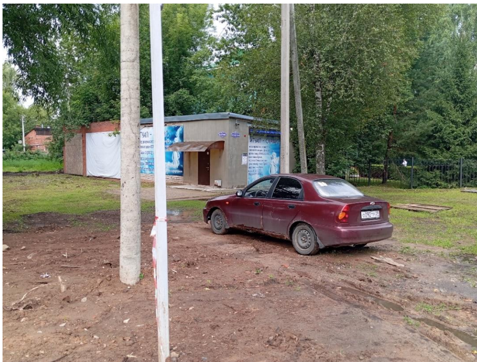
Фото 3. Элементы застройки улицы Чаева. Строение № 4 – напротив здания № 6/16.