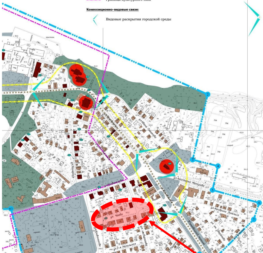
Рис. 6. Фрагмент основного чертежа проекта границ исторического поселения «Город Кинешма Ивановской области». Территория улицы Чаева обозначена красным овалом