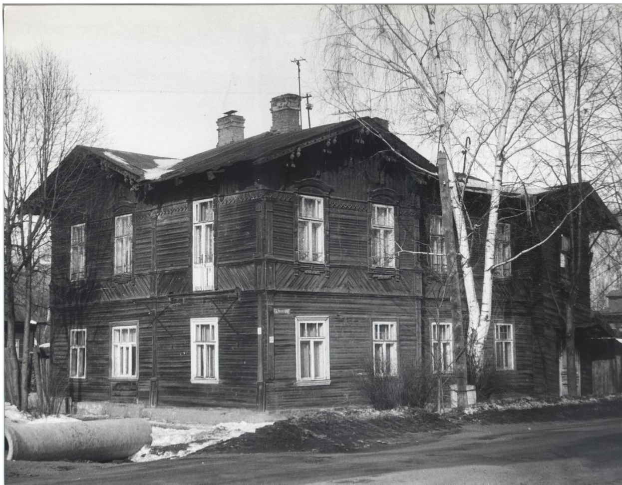
Рис. 2. Фото дома № 6 в 1988 г. из архива Комитета Ивановской области по государственной охране объектов культурного наследия.