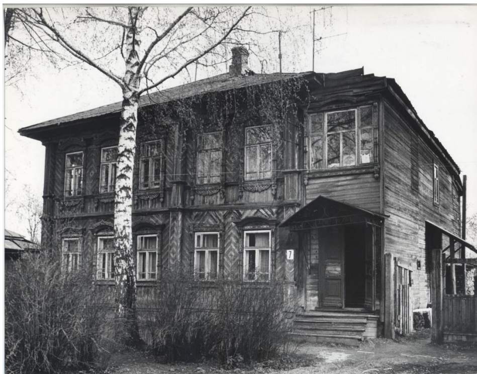
Рис. 3. Фото дома № 7 в 1988 г.

Однако данный дом не сохранился (снесён).