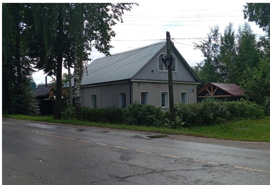
Фото 4. Дом № 5 по улице Чаева – напротив дома № 6/16, соседний с домом № 7.

Улица Чаева полностью входит в территорию исторического поселения федерального значения «Город Кинешма Ивановской области». Соответственно, на территорию улицы распространяется Предмет охраны исторического поселения, утверждённый Приказом Министерства Культуры Российской Федерации от 12 ноября 2015 г. № 2782 «Об утверждении границ территории и предмета охраны исторического поселения федерального значения город Кинешма Ивановской области».