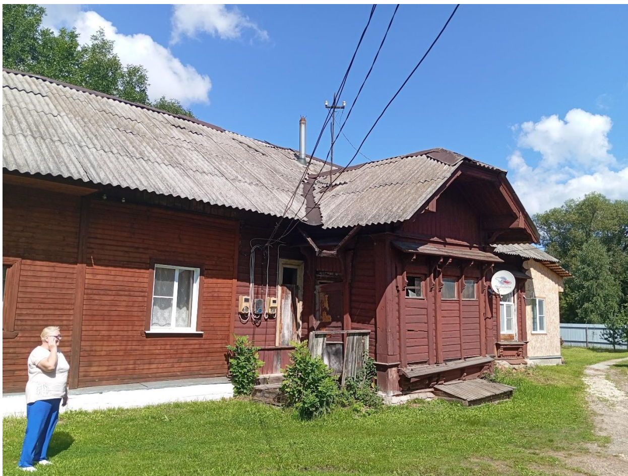
Фото 10. Второй жилой дом персонала станции.

Второй жилой дом также схож по архитектурным и стилистическим решениям с домом, в котором родился В.И. Ястребцов. Однако он более искажен поздними пристройками.