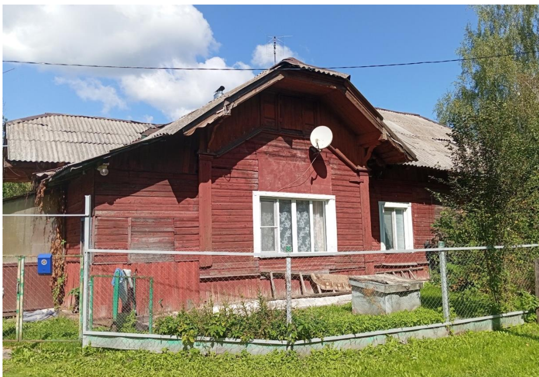
Фото 1. Общий вид объекта в 2025 г. Юго-восточный фасад

Здание представляет собой линейно вытянутый объём, состоящий из основного блока с высокой вальмовой крышей и примыкающих к нему небольших ризалитных выступов с полувальмовыми крышами, врезающимися в скаты основной. В основном объеме окна – вертикально ориентированные, размерами около 1,2×1,5 м, а в примыкающих – первоначально более крупные, размерами около 1,6×2 м, что говорит о расположении там парадной комнаты. В торцевых примыкающих объёмах предусмотрены входы. В архитектурно-художественном решении дома чувствуется влияние модерна. Углы ризалитных объёмов украшены угловыми лопатками, большой вынос крыши поддержан балками на изогнутых кронштейнах над лопатками, на северо-западном фасаде сохранился сандрик-козырек над некогда крупным окном (ныне уменьшенным) также поддерживаемый изогнутыми кронштейнами. Над крупными окнами в ризалитных объёмах – невысокие горизонтально ориентированные тройные окна чердака.