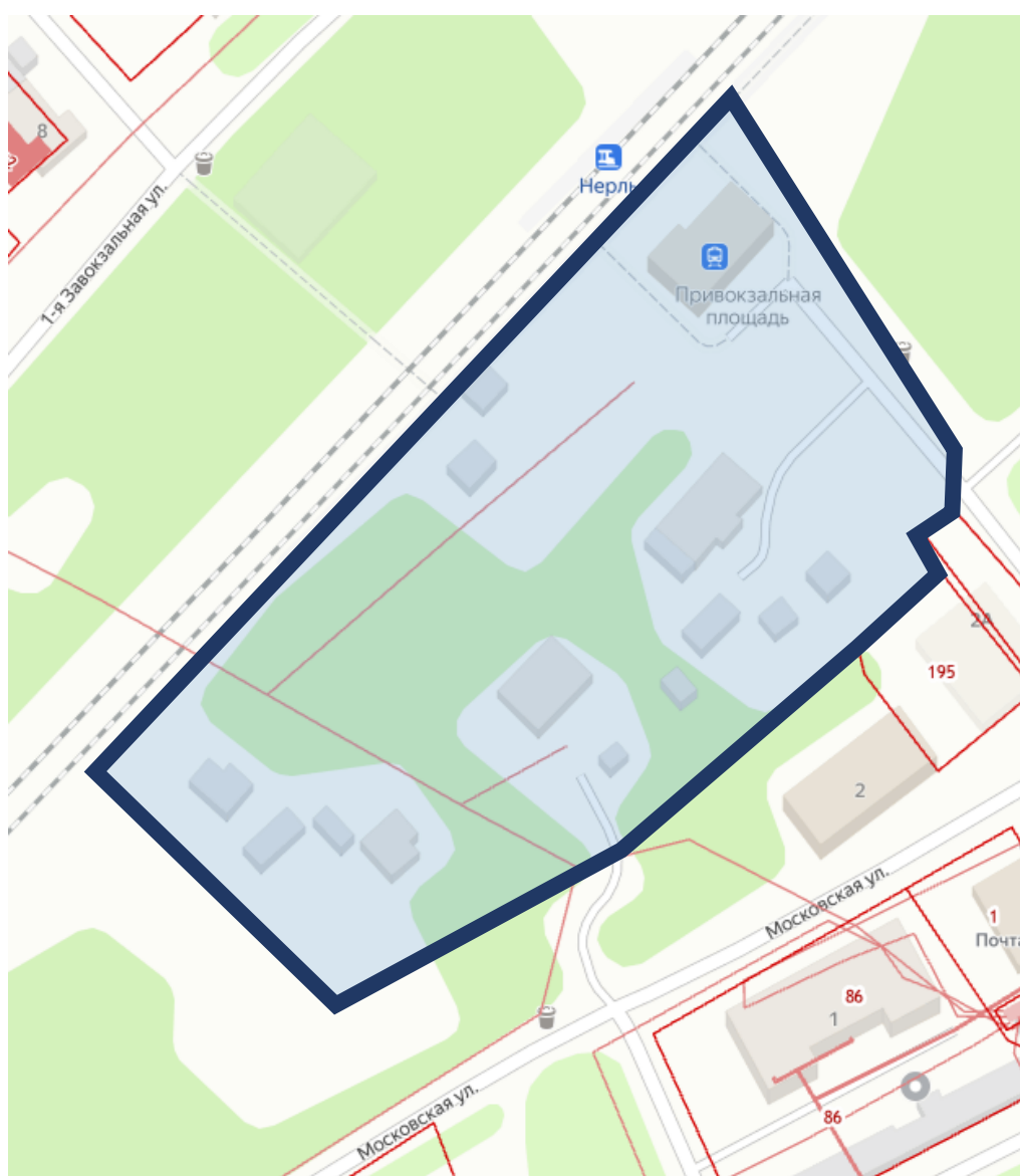
Рис. 4. Фрагмент публичной кадастровой карты места расположения ОКН. Устанавливаемая граница обозначена синей линией, территория объекта – в слабой голубой заливке

Е. Границу объекта культурного наследия установить с учётом исторических поземельных планов и сложившейся на сегодняшний день земельно-кадастровой структуры.