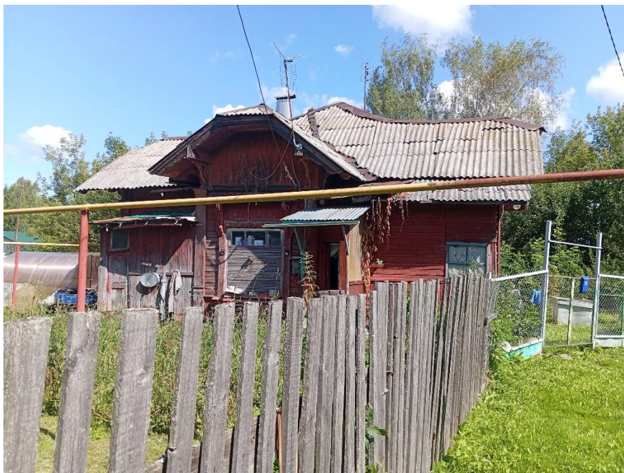
Фото 3. Общий вид объекта в 2025 г. Юго-западный фасад

Судя по архивным фото объём дома сохранился в первоначальном виде. Однако утрачены первоначальные наличники окон, исторические рамы заменены на новые пластиковые с полным изменением рисунка расстекловки.