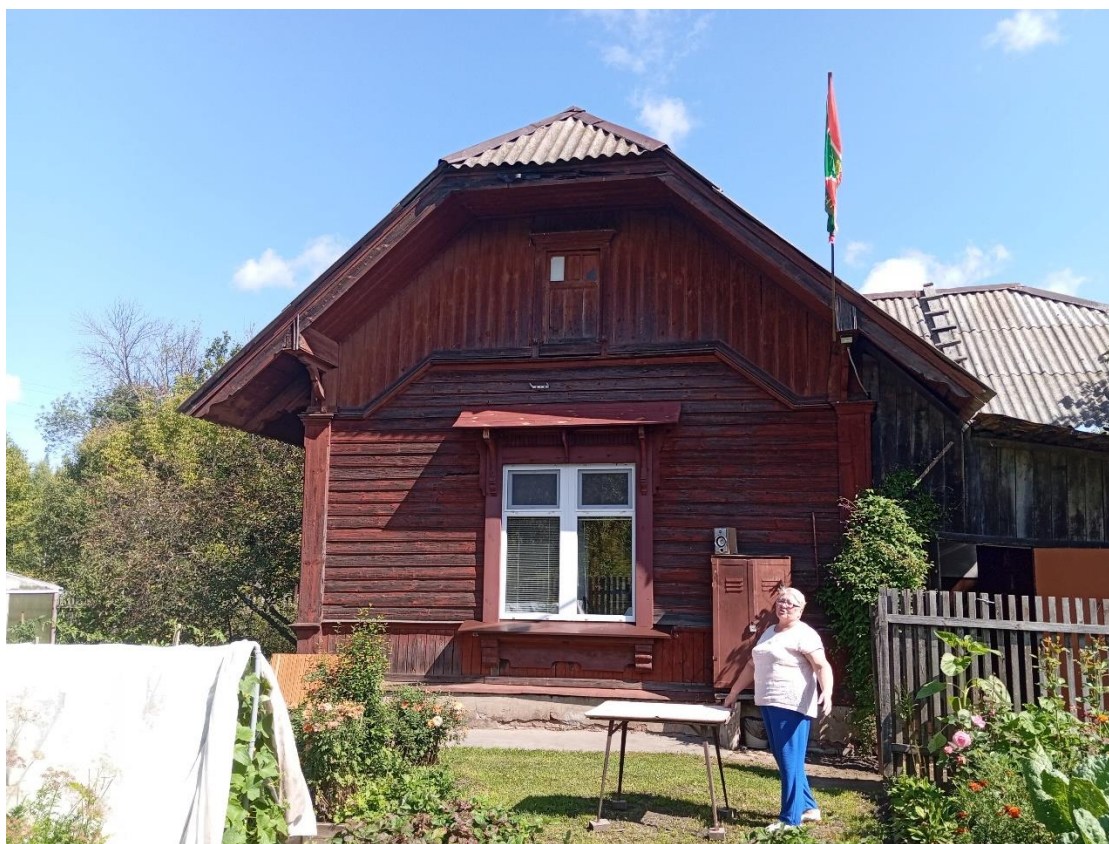
Фото 8, 9. Жилой дом начальника станции.