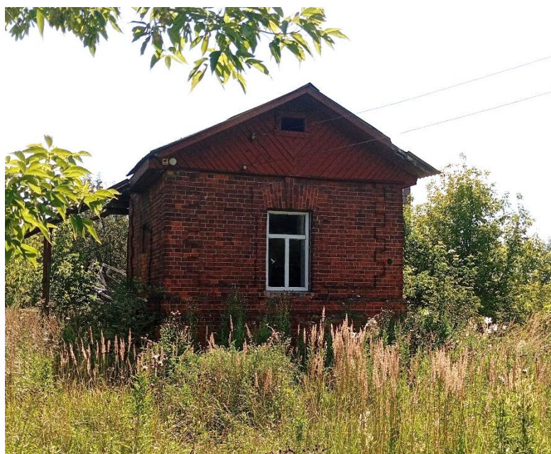
Фото 7. Сохранившаяся часть объёма водонапорной башни.

Частью производственной инфраструктуры комплекса была водонапорная башня. Ныне от неё сохранился только первый этаж, выполненный из кирпича. Вышележащие конструкции, где должен был находиться бак с водой, обычно выполнявшиеся деревянными, видимо, был утерян в советское время за ненадобностью.