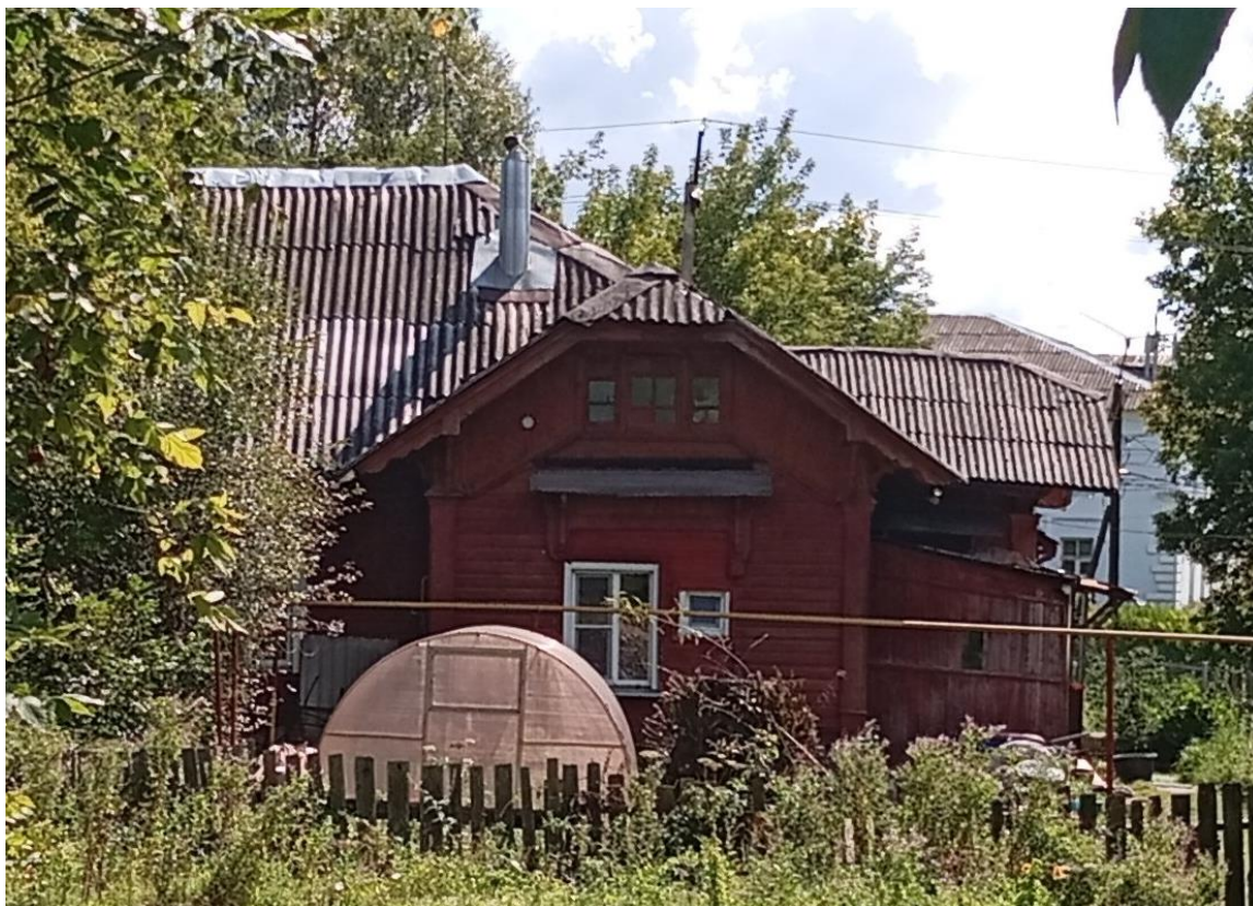
Фото 2. Общий вид объекта в 2025 г. Северо-западный фасад