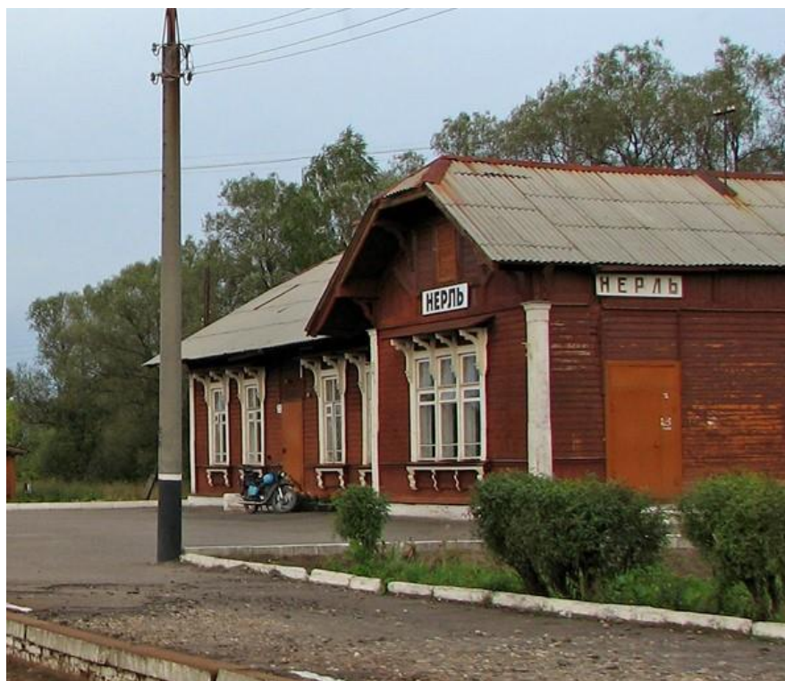
Фото 5. Общий вид вокзала со стороны ж/д перрона до реконструкции.