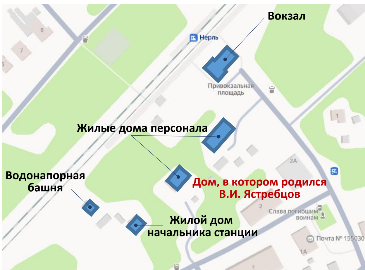
Рис. 3. Состав комплекса построек станции Нерль.