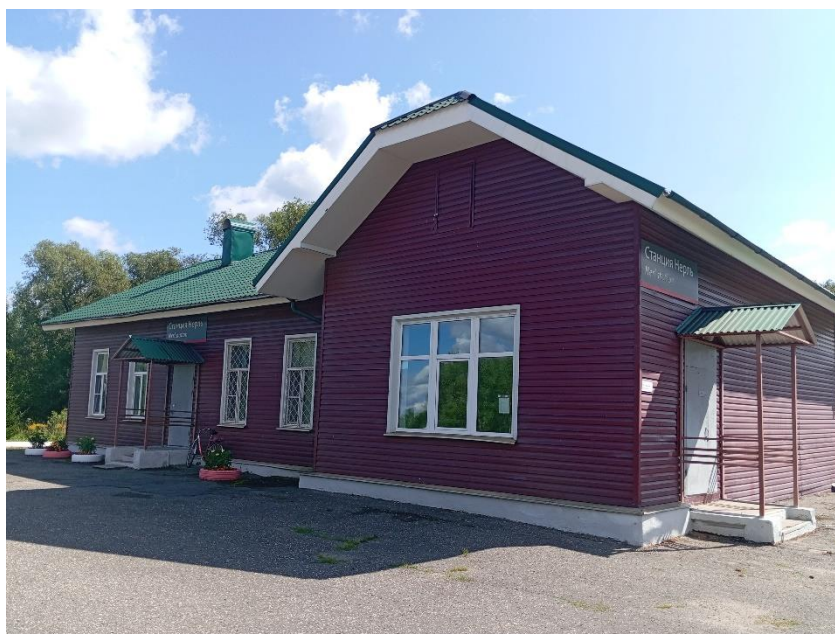
Фото 4. Общий вид вокзала со стороны ж/д перрона в 2025 г.

мов были украшены угловыми лопатками, а большой вынос крыши был поддержан балками на изогнутых кронштейнах над лопатками. Окна были обрамлены наличниками с ушками, над ними располагались сандрики-козырьки, также поддерживаемые изогнутыми кронштейнами. Над крупными окнами в ризалитных объёмах были невысокие горизонтально ориентированные тройные окна чердака.