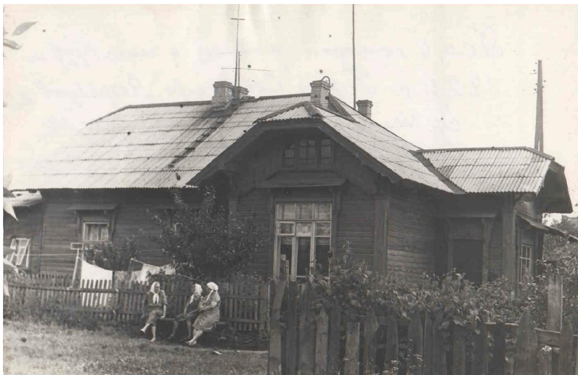
Рис. 2. Фото объекта в 1974 г. (северо-западный фасад)