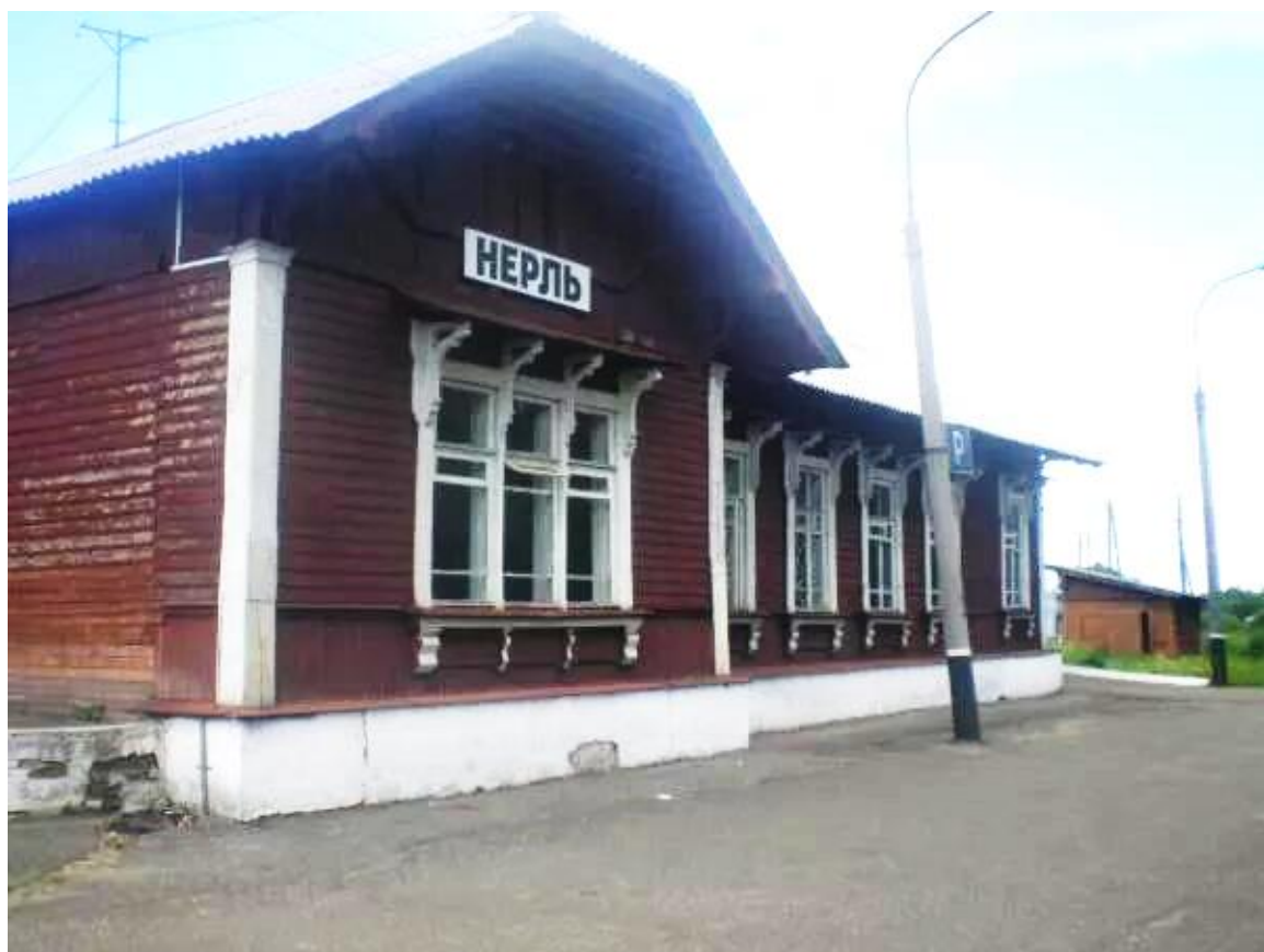
Фото 6. Общий вид вокзала со стороны привокзальной площади до реконструкции.

Частью производственной инфраструктуры комплекса была водонапорная башня. Ныне от неё сохранился только первый этаж, выполненный из кирпича. Вышележащие конструкции, где должен был находиться бак с водой, обычно выполнявшиеся деревянными, видимо, был утерян в советское время за ненадобностью.