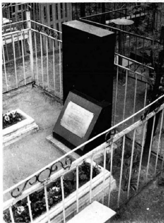
УЧЕТНАЯ КАРТОЧКА (оборотная сторона)

В июле 1969 г. взамен уже потерявшего свой вид каменного надгробия, на средства общества охраны памятников истории и культуры, было поставлено новое надгробие из металла, окрашенное под мрамор.